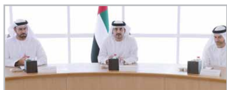
■ الشيخ مكتوم بن محمد بن راشد خلال الاجتماع

وهفت الشركة أرباحاً بقيمة 4,72 مليون دينار في الربع الثالث من العام الجاري، مقابل أرباح بنحو 4,31 مليون دينار في نفس الفترة من العام السابق، بارتفاع نسبته 9,5٪. كانت أرباح "نور" ارتفعت بنسبة 76,7٪ في النصف الأول من العام الجاري، لتصل إلى 8,82 مليون دينار، مقابل أرباح الفترة نفسها من عام 2020 البالغة 4,99 مليون دينار. من ناحية أخرى، أعلنت بورصة الكويت إعادة تداول أسهم "نور" اعتباراً من اليوم الأربعاء الموافق 3 نوفمبر 2021، وذلك بعد انتهاء فترة إيقاف سهم الشركة عن التداول لمدة 10 أيام بناءً على قرار لجنة النظر في المخالفات بالبورصة.