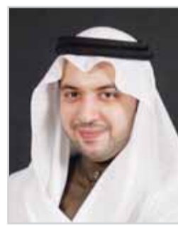
■ مبارك العبدالله الصباح

تعبئة لضغوطات الأزمة الصحية والاقتصادية التي يشهدها العالم، الا ان بوادر التحسن التدريجي في بيئة أعمال كافة استثماراتنا بالمجمل قد بدأت بالظهور. ونحن على ثقة بأن تنوع