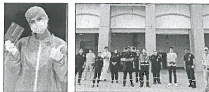
عضوه في فريق خدمة العملاء