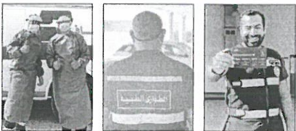
عضوه في فريق خدمة العملاء

الجهود الحكومية في مجابهة انتشار الوباء، فضلاً عن دعم جميع الخطوات الوقائية التي أطلقتها الدولة من أجل مكافحة تفشي فيروس كورونا، ومن هذا المنطلق، وتماشياً مع التعليمات الحكومية للحفاظ على سلامة الجميع، تواصلت شركة stc بتدبير كل ما لديها لدعم الجميع المساهم في منازلهم، وأضأت الجاسم: من منطلق دورنا المجتمعي، أطلقنا سلسلة من الأنشطة والمبادرات الإنسانية التي تهدف إلى مساندة أهل الكويت في مواجهة الظروف الاستثنائية الحالية التي يمر بها البلاد، ويؤكد في الوقت ذاته على دور القطاع الخاص والهجم والمتطوعي دعم وجهات الدولة، ولخدمة معاناتها بشكل أفضل، قامت الشركة بتعزيز قنولتها الرقمية لتقديم مجموعة منتجات وخدمات الجاسم وللمعالجة البدد والحائين وهم في تم راحة بمنازلهم.