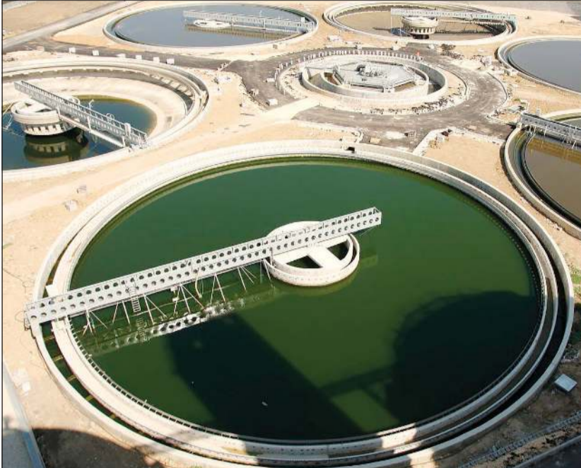
أحد نماذج محطات معالجة مياه الصرف الصحي

عازلة تحت الأرض بسعة 50 ألف متر مكعب ومحطة نفريغ صهاريج بنفس السعة. بالإضافة إلى ذلك، سيقيم المقاول الفائز ببناء شبكة مياه الصرف الصحي المعالجة (TSE) من الخزانات في محطة معالجة المطلاع إلى شبكات الري في مدينة المطلاع، وخط مياه بطول 40 كيلومترا من خزانات معالجة مياه الصرف الصحي في المطلاع، ووفقا لبيانات حصلت عليها «الأنباء»، فإن المناقصة التي طرحت في 30 أغسطس الماضي تعتبر عامة لجميع الشركات ويبلغ التأمين الأولي نحو 2,6 مليون دينار، وقامت وزارة الأشغال بعقد اجتماع تمهيدي في 20 سبتمبر الماضي للمقاولين المهتمين بالمناقصة.