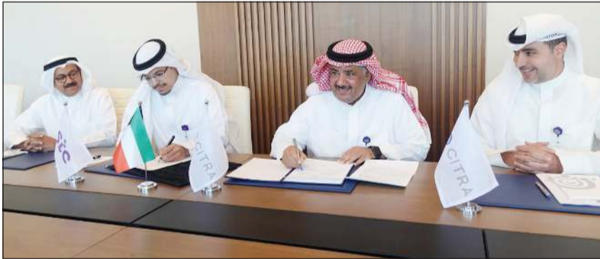
رئيس مجلس إدارة هيئة الاتصالات بالإتابة عبدالله العجمي والرئيس التنفيذي لشركة «stc» معتز الضراب أثناء توقيع عقد تأجير القسيمة (كويتا)

كويتا: أعلنت الهيئة العامة للاتصالات وتقنية المعلومات توقيع عقد مع شركة الاتصالات الكويتية (STC) لتأجير قسيمة بمساحة 5698,5 مترا مربعا لإنشاء مقر إداري ومبنى مواقف متعددة الأدوار في محافظة العاصمة. وذكرت الهيئة في بيان أن هذا العقد يأتي تنفيذا لقرار مجلس الوزراء رقم 1274 لسنة 2023 ولائحة (بدل الارتفاع) بأملاك الدولة الخاصة العقارية المخصصة للهيئة العامة للاتصالات وتقنية المعلومات ورسوم الخدمات). وأوضحت أن الرسم السنوي للقوائم المخصصة لشركات الاتصالات المرخصة حدد بـ 88,500 دينار لكل متر مربع، مضافةً إلى العقد وقعه كل من رئيس مجلس إدارة الهيئة بالإتابة عبدالله العجمي والرئيس التنفيذي لشركة (STC) معتز الضراب. وأشارت الهيئة إلى مواصلة جهودها لتوفير بيئة مواتية لجذب الاستثمارات والمشاريع الجديدة، مؤكدة التزامها بدعم التعاون مع القطاع الخاص لتحقيق التنمية المستدامة وتلبية تطلعات المواطنين نحو خدمات متقدمة وعالية الجودة. ونقل البيان عن العجمي قوله إن توقيع العقد يمثل خطوة إستراتيجية نحو تعزيز التعاون بين القطاعين العام والخاص، مشيرا إلى أن إنشاء المقر الإداري الجديد لشركة (STC) سيسهم في تطوير خدماتها بما ينعكس إيجابيا على تجربة العملاء. ولفت إلى أن القيمة الإجمالية للعقد تتجاوز 10 ملايين دينار (نحو 33 مليون دولار) لمدة 20 عاما، مؤكدا أن هذه الخطوة تأتي في إطار جهود الهيئة لدعم قطاع الاتصالات وتكنولوجيا المعلومات في الكويت بما يتماشى مع رؤية الوطني بما يتماشى مع رؤية الكويت 2035، بهدف من خلال هذا المشروع إلى دعم قطاع الاتصالات وتكنولوجيا المعلومات من خلال تأسيس مقر إداري متطور يعزز البنية التحتية ويسهم في تمكين التحول الرقمي.