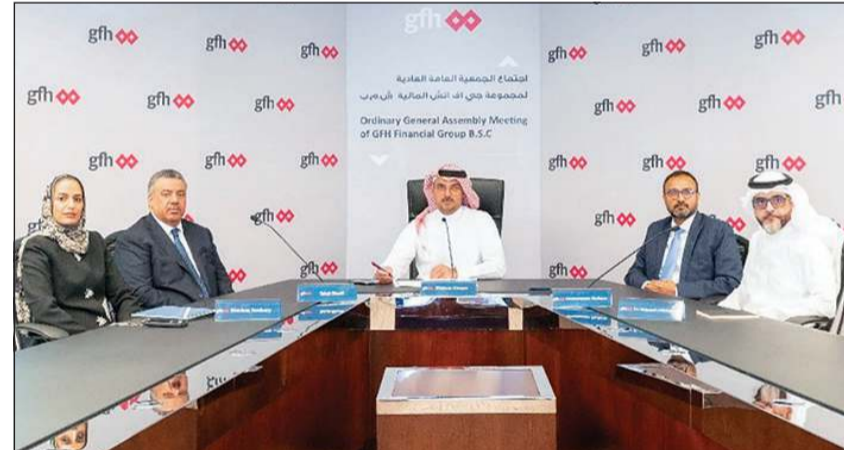
مهام الرئيس خلال الجمعية العمومية لمجموعة «جي إف إتش»

عقدت مجموعة جي إف إتش المالية اجتماع الجمعية العامة العادية للمجموعة، والذي عقد مباشرة عبر وسائل الاتصال المرئية بنصاب بلغ 39,14% من المساهمين، بالإضافة إلى أعضاء مجلس إدارة المجموعة والإدارة والموظفين. وشهد الاجتماع موافقة المساهمين على محاضر الاجتماع السابق الذي عقد في 24 مارس 2024، وعلى توصيات مجلس الإدارة لتأسيس برنامج إصدار شهادات الثقة (برنامج الصكوك) بقيمة تصل إلى 500 مليون دولار من خلال شركة ذات غرض خاص، بشرط الحصول على الموافقات التنظيمية اللازمة وغيرها من الموافقات المطلوبة، كما وافق المساهمون على إصدار الصكوك بمبلغ 500 مليون دولار في شريحة واحدة أو أكثر من خلال الشركة ذات غرض خاص.