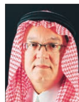
الأمير عمرو الفيصل

أي بزيادة 14.8٪ مقابل 37.81 مليون دينار بحريني سجلت في الفترة نفسها من 2018. من جانبه، قال الرئيس التنفيذي لبنك الإثمار أحمد عبدالرحيم إن نمو الأرباح يعكس التزام البنك بالتركيز على مواصلة تعزيز تجربة العملاء المصرفية.