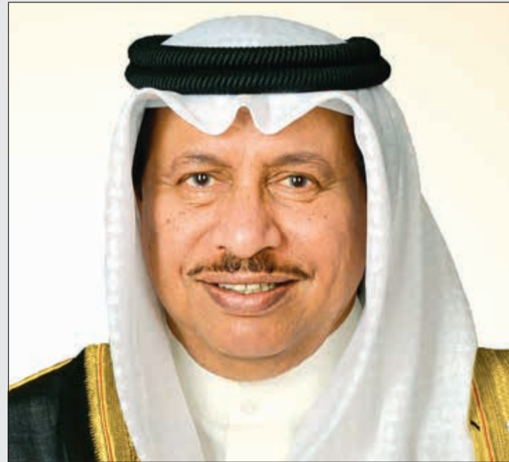
سمو رئيس مجلس الوزراء الشيخ جابر المبارك