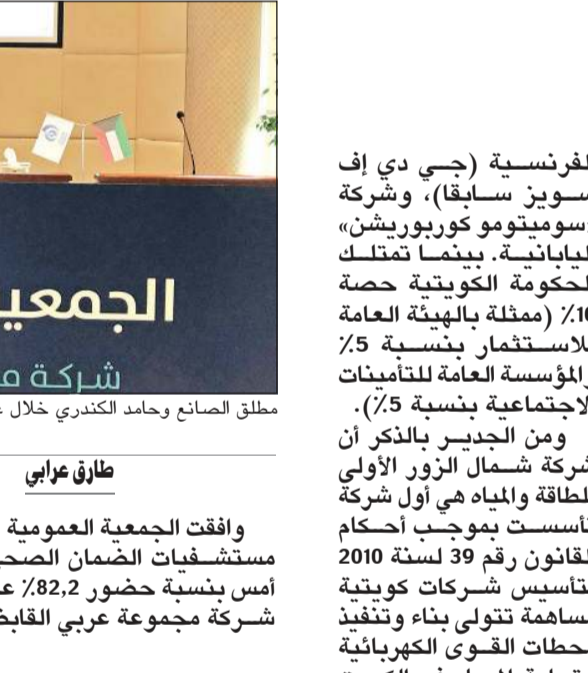
جانب من عمومية شركة شمال الزور الأولى

وافقته الجمعية العامة غير العادية «المؤجلة» لشركة شمال الزور الأولى للطاقة والمياه، التي تم اكتتاب فيها بنسبة 50% من أسهم رأس مال الشركة من قبل المواطنين الكويتيين في ديسمبر 2019، على تعديل بعض البنود الأساسية، وإضافة فقرة جديدة لأحد البنود. ووافقت العمومية غير العادية أيضا التي عقدت أمس بنسبة حضور 50.1%، على توصية مجلس الإدارة بإضافة فقرة جديدة برقم (حادي عشر) للمادة (49) من النظام الأساسي للشركة للسماح بتوزيع أرباح مرحلية طبقا لنص المادة 226 من قانون الشركات رقم 1 لسنة 2016 وتعديلاته، وعلى تعديل المادة 56 من النظام الأساسي للشركة لتصحيح الإشارة إلى القوانين ذات الصلة. وأثناء الاجتماع، أعرب الرئيس التنفيذي في شركة