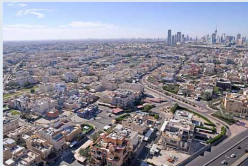
قفزة كبيرة في قيمة موجودات الدولة العقارية بنهاية العام الفائت

عنها، والتي من بينها مشروع نظم المعلومات الجغرافية، الذي يهدف إلى بناء نظام معلومات جغرافي متكامل، يمكنها من أرشفة الخرائط والوثائق، بما يكفل الرجوع إليها والتعامل معها، وهي الخطوة التي تأتي في إطار بناء نظام شامل لنظم المعلومات الجغرافية المؤسسية، لتحديد وإدارة ومراقبة أملاك الدولة العقارية، ورفع كفاءة الأعمال في إدارة عقارات أملاك الدولة وإدارة العقود، وإدارة نزع الملكية للمنفعة العامة، حيث تتولى الوزارة الكثير من العمليات الخاصة بإدارة الأراضي والعقارات المملوكة للدولة، بما يشمل نزع ملكية العقارات الخاصة عند الحاجة إليها للمنفعة العامة، وتاجير الأراضي المملوكة للدولة من شاليهات وأسواق ومزارع، وشراء أو نقل ملكية الأراضي، نيابة عن الدولة، وإدارة المشروعات بنظام البناء والتشغيل BOT، إضافة إلى عدد من المهام الأخرى المتعلقة بإدارة أملاك الدولة ومراقبتها. ويمكن مشروع نظام المعلومات المعنيين من التعرف على مناطق التعديلات على أملاك الدولة، وقيمة تلك التعديلات والغرامات وتكلفة إزالة تلك التعديلات، كما أن من شأن هذا النظام العمل على حفظ الخرائط القديمة ومنعها من التلف وتحديد التعديلات.