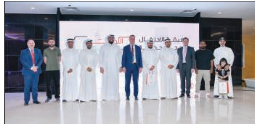
فريق الشركة والمصورين في لقطة جماعية