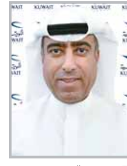
■ معن زروقى

ثابتة نمو تنوع شبكة خطوطها حول العالم وإطلاق وجهات جديدة تواكب أحدث ما يقدمه قطاع النقل الجوي التجاري في العالم". من جانبه، قال الرئيس التنفيذي معن زروقى أن الكويتية أحدثت نقلة نوعية من حيث إطلاق الوجهات والخدمات الجديدة كليا، ويأتي ذلك من خلال جهود أبنائها المخلصين وحرصهم وتقانيهم في العمل على تطوير وتحسين ناقلهم الوطني. وأضاف "إطلاق وجهات موسم الصيف يسير وفق خطط ودراسات دقيقة حول جدوى هذه الأسواق والوجهات ومدى إقبال الملاء عليها وفاقنتها على الكويتية، وتتميز الـ14 وجهة التي تم الإعلان عنها بأنها تشهد إقبالا في موسم الصيف لذلك أعلنت الكويتية عن إطلاق وجهات إلى تركيا مثل أنطاليا وطرابزون ويودروم بداية من يونيو وأزيمير بداية من 18 إبريل إضافة إلى إسطنبول كوجهة أساسية، كذلك وجهات أخرى أوروبية اعتباراً من يونيو المقبل مثل بودابست ونيس وملقا وأثينا وفيينا وميونخ وسراييفو وميكانوس، علاوة على ذلك شرم الشيخ وصلالة".