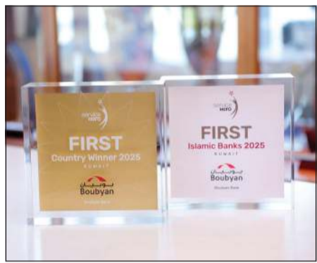
جوائز سيرفس هيرو لبنك بوبيان

احتياجاتهم، ضمن منهجية متكاملة تطبق وفق أفضل الممارسات العالمية، بما يساهم في تحسين جودة الخدمة وإدارة توقعات العملاء بكفاءة عالية. وأكد أن هذا الإنجاز واستمرار الحفاظ على الصدارة لم يكن ليحقق لولا الجهود المتواصلة لفريق العمل، الذي يمثل أحد أهم عناصر النجاح، من خلال التزامه بتقديم أفضل تجربة للعملاء، وحرصه على تطوير أدائه بشكل مستمر بما يعزز من