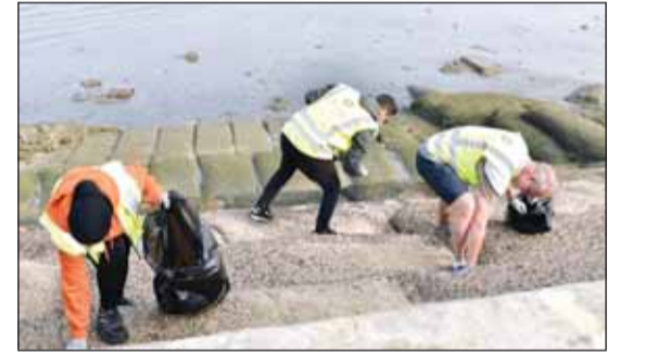
جانب من حملة النظافة

كجزء من سياسات المسؤولية المجتمعية وحوكمة الشركات التي تحت مظلة مجموعة الملا على المشاركة في الأنشطة المجتمعية لدعم المبادرات البيئية الهادفة إلى الحفاظ على بيئة مستدامة في الكويت، شارك أكثر من 100 موظف من مجموعة الملا مؤخرًا في حملة تنظيف الشواطئ السنوية التي أقيمت يوم 18 الجاري في شاطئ الشويخ. وقد لاقى هذه المبادرة الطوعية إقبالاً ملحوظاً من موظفي مجموعة الملا حيث شهدت فعالية مشاركة كبيرة من موظفي الهندسية، الملا للتعمير، الملا للصرافة، الملا للإيصال والتأجير وعدد من أعضاء الفريق التطوعي من الهيئة العامة للبيئة في الكويت. وإلى جانب الفعالية التطوعية لتنظيف الشواطئ، استمتع موظفونا أيضاً بضيافة مميزة من وجبات الفطور والمشروبات الساخنة.