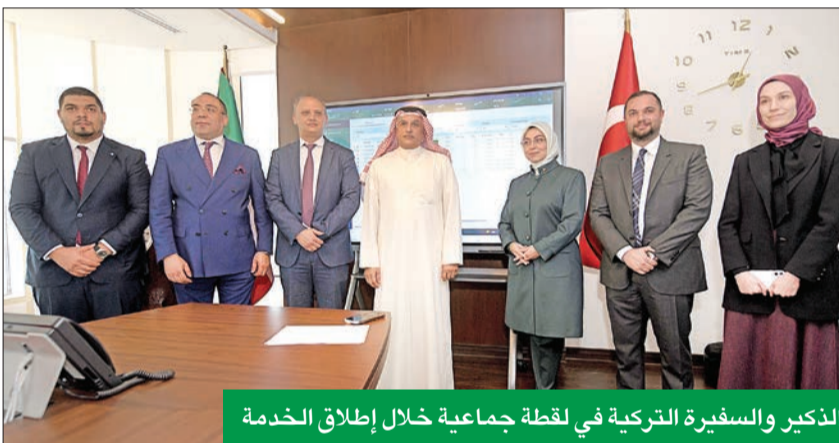
الذكير والسفيرة التركية في لقطة جماعية خلال إطلاق الخدمة

الأسواق التي تغطيها إلى 8 أسواق رئيسية، تبدأ من «بورصة الكويت»، ثم سوق المال السعودي «تداول»، إلى جانب أسواق كل من الإمارات وقطر والبحرين ومسقط والسوق المصري، بينما يمثل السوق الأمريكي إحدى الوجهات المهمة للعلاء المحليين.