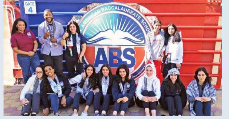
طلبة «البكالوريا الأمريكية» متضامنين مع فلسطين

وتظهر هذه المبادرة النبيلة التزام المدرسة بالمسؤولية الاجتماعية وقدرتها على تحفيز التأثير الإيجابي في المجتمع، مع التأكيد على أن التعليم ليس فقط في اكتساب المعرفة ولكن أيضاً عن تشكيل قياديين قادرين على تحقيق التغيير الإيجابي.