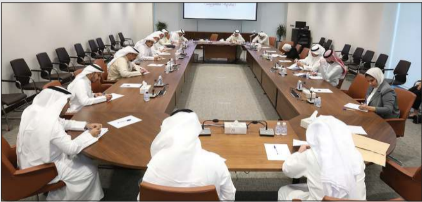
جانب من اختبارات الوظائف الإشرافية في البلدية