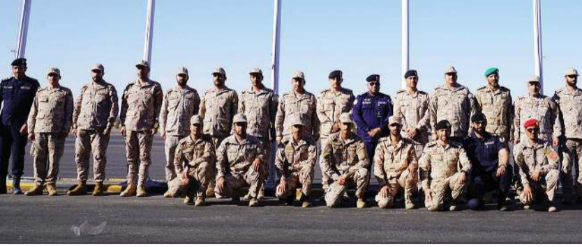
القوات السعودية لدى وصولها

وصلت إلى البلاد عبر منفذ السالمي قوات المملكة العربية السعودية الشقيقة المشاركة في تمرين تكامل 1، والذي ستنفذ فعالياته في منطقة التدريب (الأديرع - الأبرق) الواقعة شمال غرب البلاد خلال الفترة من 26 نوفمبر ولغاية 7 ديسمبر 2023 بقيادة الجيش الكويتي ممثلاً بتشكيلات من القوة البرية وقوات درع الجزيرة. وسيستمر توافد باقي القوات المشاركة في التمرين عبر المنافذ الثلاثة (الجوية - البرية - البحرية) خلال الأيام القليلة القادمة.