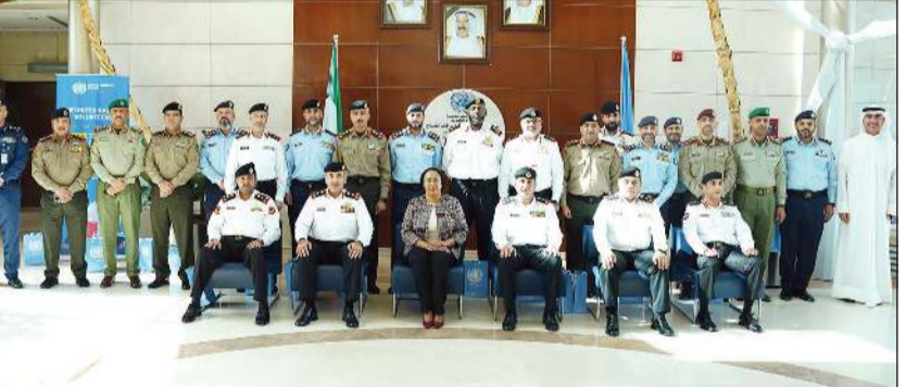
منتسبو برنامج تأهيل القيادات العليا للمستوى الاستراتيجي رقم (4) خلال زيارتهم مقر الأمم المتحدة في الكويت

قالت وزارة الدفاع إن منتسبي برنامج تأهيل القيادات العليا للمستوى الاستراتيجي رقم (4) زاروا مقر الأمم المتحدة في الكويت، وذلك ضمن فعاليات الأسبوع الأول من البرنامج الذي يتطرق للسياسات الاستراتيجية المحلي والإقليمي والعالمي. وذكرت الوزارة في بيان صحفي إن منتسبي البرنامج تلحقوا خلال الزيارة محاضرة عن «المنظمات الدولية وتأثيرها على العمليات العسكرية»، ألقها المنسق المقيم للأمم المتحدة في الكويت غادة الطاهر. وينعقد برنامج تأهيل القيادات العليا للمستوى الاستراتيجي رقم 4 من 19 الجاري إلى 17 ديسمبر المقبل، ويهدف إلى تطوير المعرفة للضباط القادة بالسياسات الوطنية والإقليمي الاستراتيجي وتعزيز الوعي والقدرات التي تساعدهم على التحليل والتخطيط والتنفيذ وفهم البيئة الاستراتيجية المحيطة.