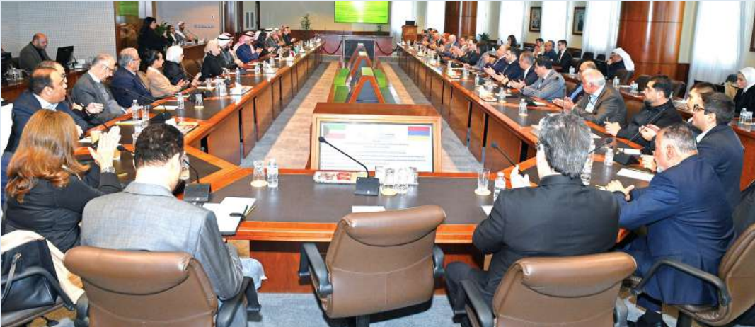
جانب من منتدى الأعمال الكويتي – الأرميني

لمزيد من المعلومات والتفاصيل يرجى الاتصال على 22255048 - 22255388