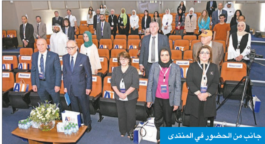
جانب من الحضور في المنتدى