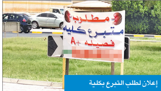
إعلان لطلب التبرع بكلية

وقال: لحل هذه المشكلة من الممكن أن تخصص الوزارة شملت وزارة الصحة لجنة محايدة ليس فيها أي من أطباء زراعة الأعضاء لمقابلة المتبرعين من غير الأقارب للتأكد من صلة المتبرع بالمريض وعدم وجود تجارة أعضاء أو تبادل بالأموال مقابل هذا التبرع، ولكن للأسف لم تستطع هذه اللجنة منع تبادل الأموال والتجارة بالأعضاء وقد شهد سعر الكلية ارتفاعاً خلال السنوات العشر الماضية من إلى أكثر من ثلاثة أضعاف هذا المبلغ في الوقت الحالي.