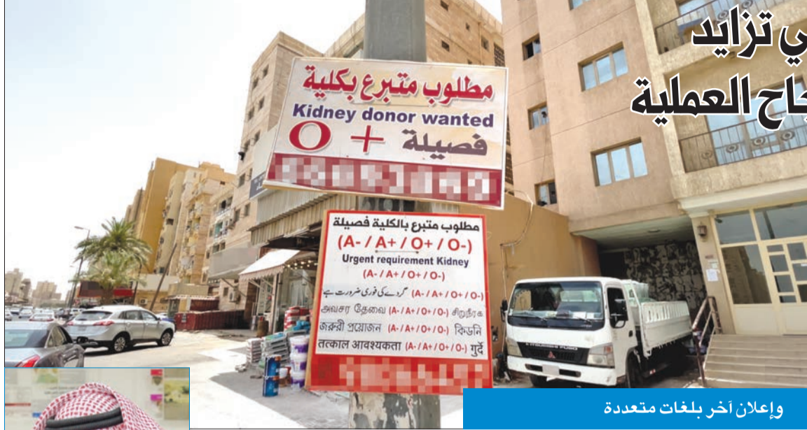
وإعلان آخر بلغات متعددة

وتابع: كما ازدادت إعلانات الطلب والعرض في مختلف أنحاء البلاد، وهذا يعد أحد صور تجارة الأعضاء التي يمنعها القانون ومحرم في الكويت والعالم، وهو ما يسيء بالتأكيد لسعة الكويت، داعياً وزارة الصحة إلى تنظيم عملية التبرع وإيقاف مثل هذه الإعلانات التي انتشرت في عدة مناطق.