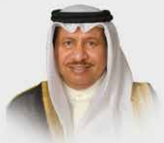
سمو الشيخ جابر مبارك الحمد الصباح رئيس مجلس وزراء دولة الكويت