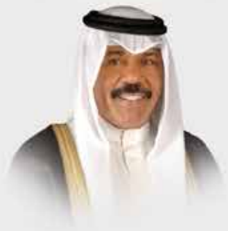
سمو الشيخ نواف الأحمد الجابر الصباح ولي عهد دولة الكويت