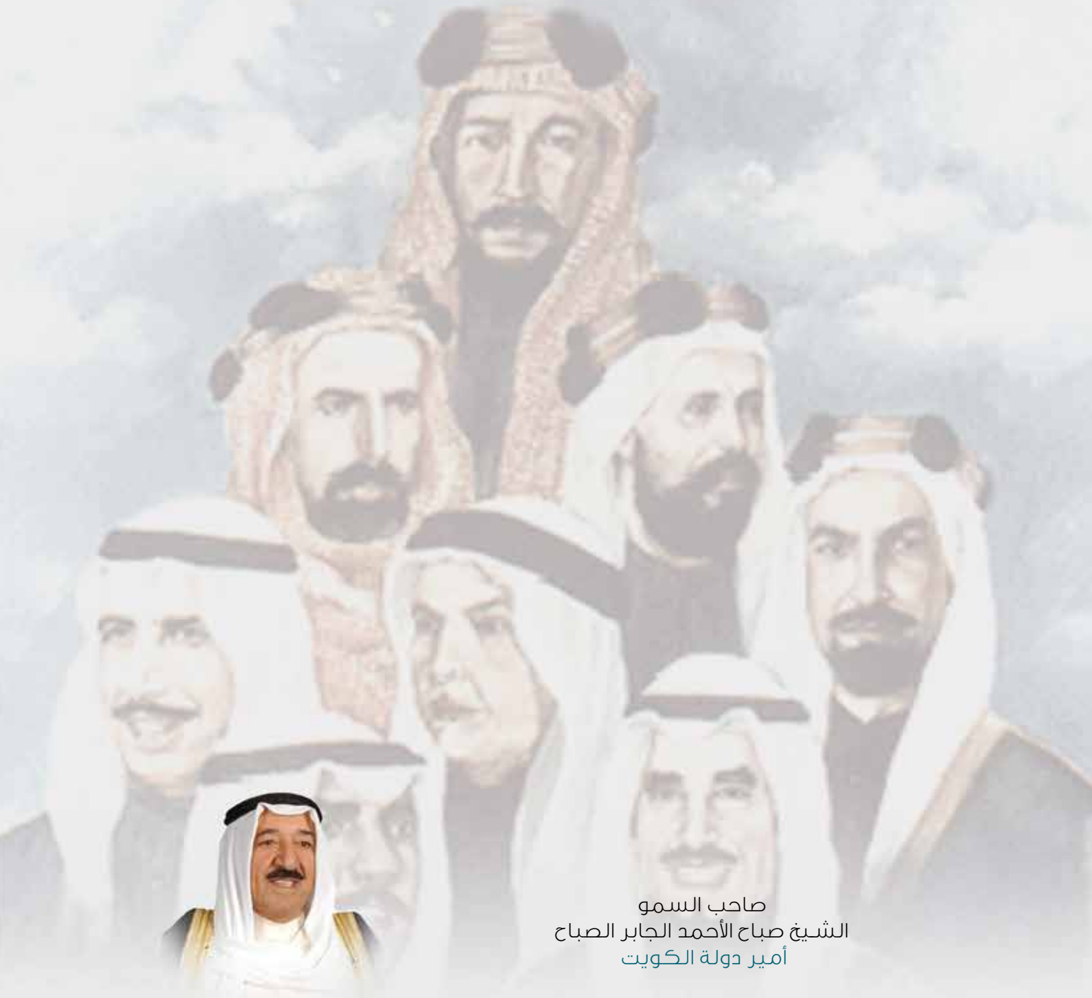
صاحب السمو الشيخ صباح الأحمد الجابر الصباح أمير دولة الكويت