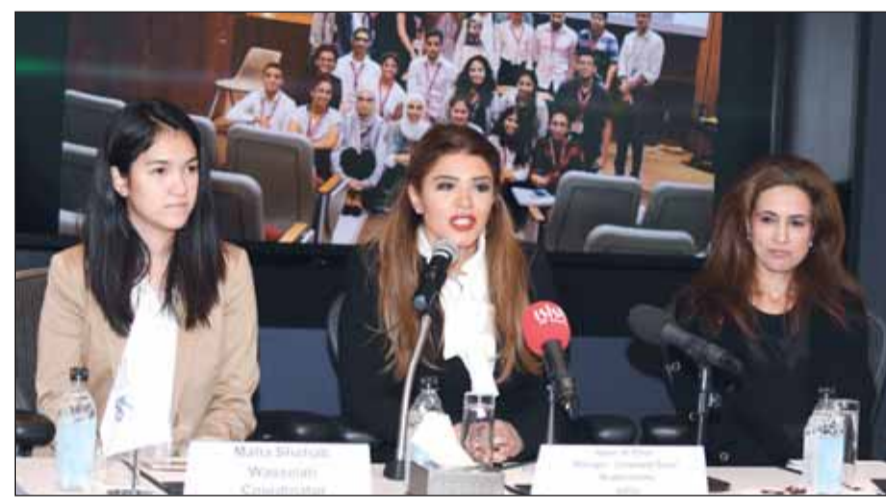
جانب من المؤتمر الصحافي